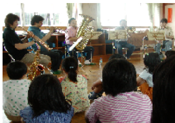
小中学校出前コンサートの様子

選りすぐりのアーティストの音色を子どもたちだけでなく、多くの方に届けたいと思い、このホワイエコンサートを企画しました。ホワイエから見える幻想的な夜景と一緒に楽しめる、素晴らしい演奏会にぜひお越しください。