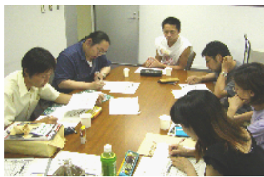
実行委員会会議風景