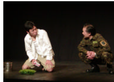
劇団きらら 『砂漠に咲く花』