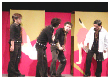
劇団一発屋 『メガミノコンセント』