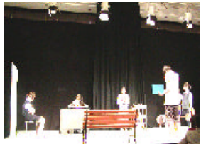
昨年度の稽古風景

演劇作品を1本つくことを目標に、夏休みの期間、高校生を対象とする演劇ワークショップを行います。ワークショップ最終日には、発表会を開催します。